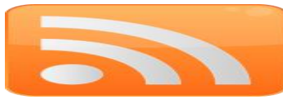
Figura 1- Símbolo da tecnologia RSS